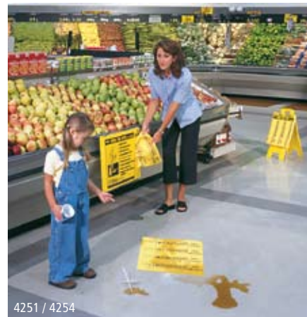
4251 / 4254