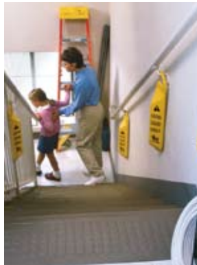
Gancho en forma de seguro ayuda a mantener la señal en su lugar.