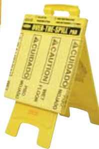
4254 en 6112