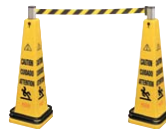
6287 (2 pzas.)